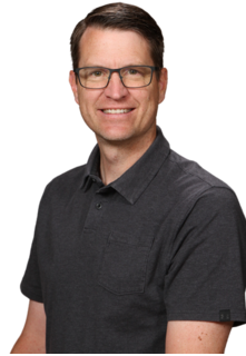
director Greg Doan

Ya estamos recibiendo solicitudes de alumnos que estarán ausentes en las fechas de los exámenes finales. Debido al cambio de calificaciones basadas en estándares, también hemos cambiado la política sobre los exámenes finales "tempranos". Ahora, tenemos esto en el manual del estudiante. Úsalo como guía para cuando los estudiantes indiquen que se irán en la fecha prevista para el examen final.