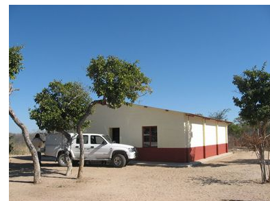
Foto links: Die kenmerkende bome van die Mangettuiduin. Foto middel: Kanovlei se kerkie. Foto regs: 'n Tipiese